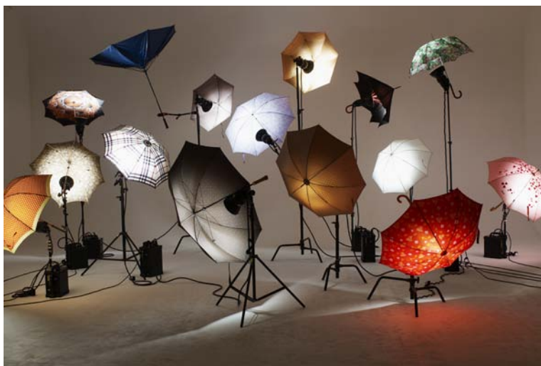
4 - Installation, Madriz, 2008