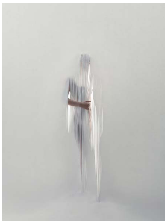
5 - Installation, Philo, 2007 © Grégoire Alexandre