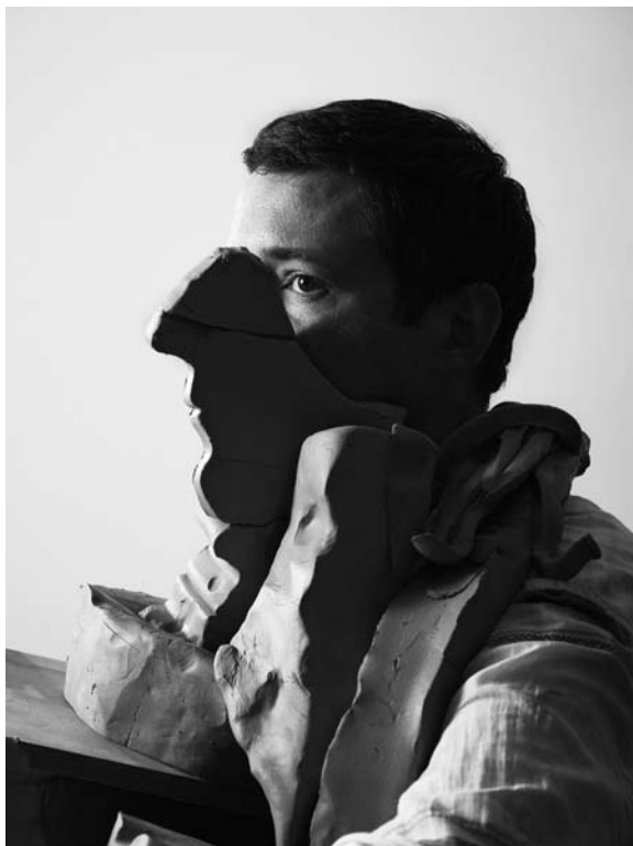
6 - Glaise 1, Jean Michel, 2013 © Grégoire Alexandre