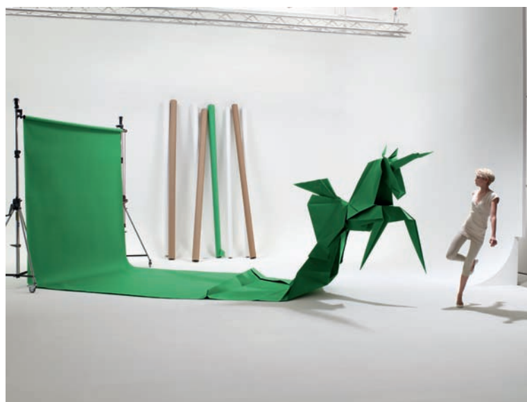
3 - Installation, Arjo Wiggins, 2009