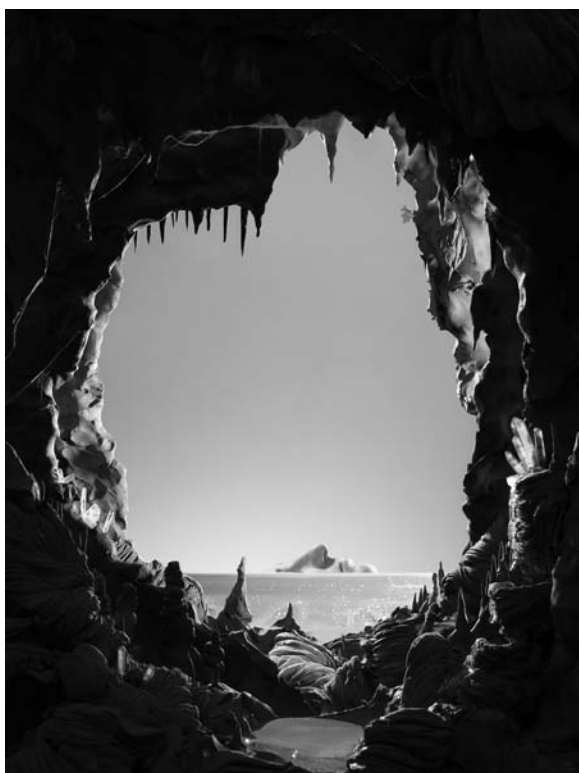
8 - Obsession, 2012 © Grégoire Alexandre