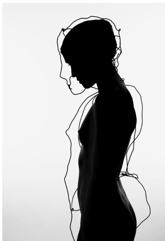
2 - Exol 1, 2010 © Grégoire Alexandre