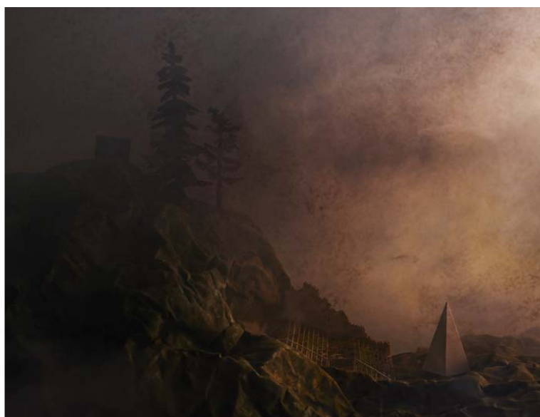
9 - Melancholia 1, 2015 © Grégoire Alexandre